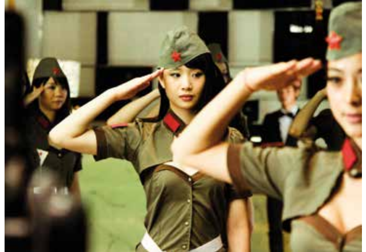
A TOUCH OF SIN

5.11. 19:45 C1 Cinema 4 8.11. 15:00 C1 Cinema 3 9.11. 15:00 C1 Cinema 3