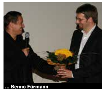
... Benno Fürmann