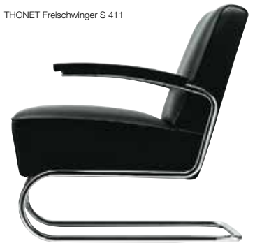
THONET Freischwinger S 411

Beim Kauf eines Sessels S 411 (Ausführung Leder „Linea“ – in 60 verschiedenen Lederfarben erhältlich) schenken wir Ihnen vom 01.09.2013 bis 31.12.2013 einen Satztisch B 97 b (decklackiert) im Wert von 407 €! Nur bei uns im Einrichtungshaus!