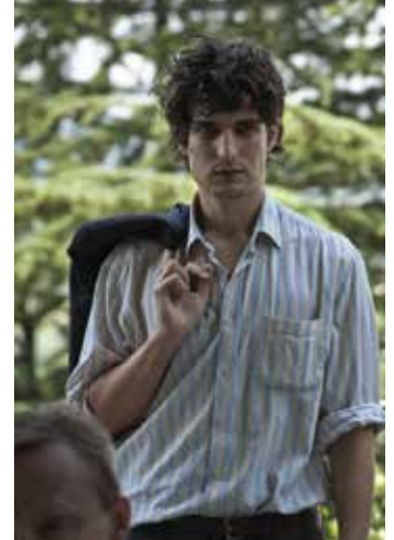
A CASTLE IN ITALY

6.11. 17:30 Universum 2 8.11. 20:00 Universum 2