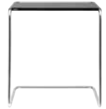
THONET Tisch B 97 b

Am Magnitor 3 · 38100 Braunschweig www.magniviertel.de/koerner