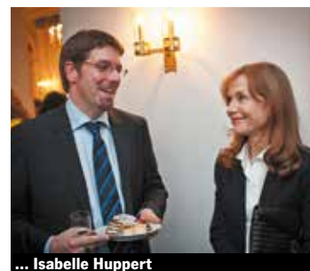
... Isabelle Huppert